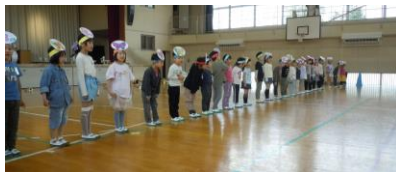
体育館で整列する1年生

1年生が入学してから3週間が過ぎようとしています。この間に授業や給食も始まり、1年生の子どもたちも少しずつ学校生活に慣れてきたようです。このような中で、「1年生を迎える会」を18日の1校時に行いました。