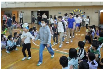
6年生に連れられて入場