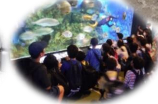
水族館にも行きました