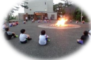
キャンプファイヤーもでき、