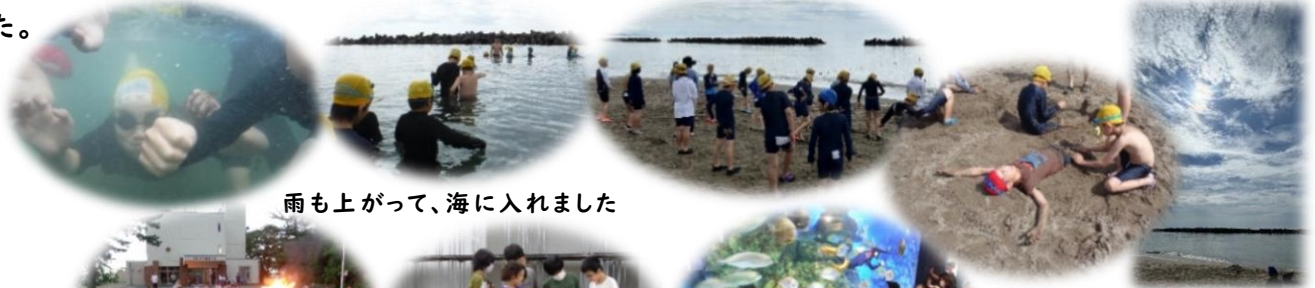
雨も上がって、海に入れました

5年生が、先週の3日と4日、一泊二日で寺泊にある臨海学校に行ってきました。雨の出発式でしたが、大きな事故等もなく、予定のプログラムは全てでき、みんな無事に帰ってきました。