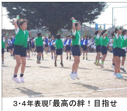
3・4年表現「最高の絆！目指せあずまの最高到達点」