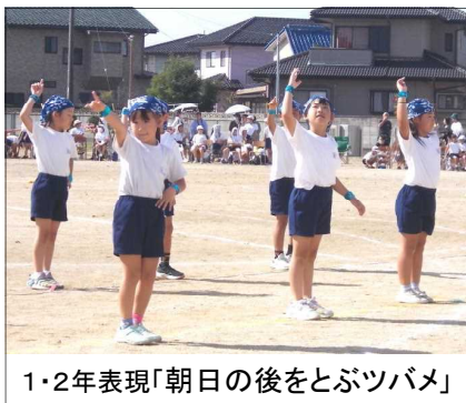
1・2年表現「朝日の後をとぶツバメ」