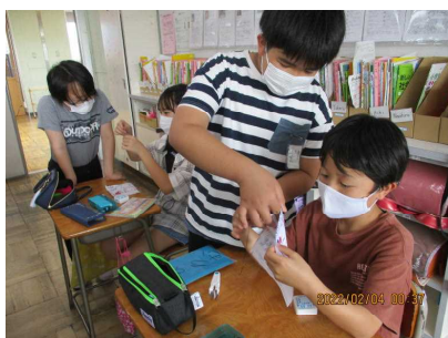
(6年生による5年生への裁縫指導)