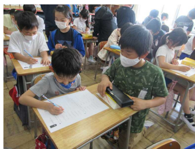
(6年生による3年生への辞書指導)