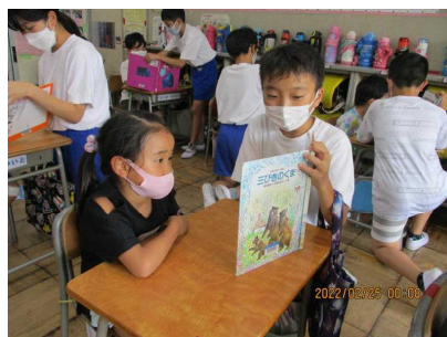
(6年生による1年生への読み聞かせ)