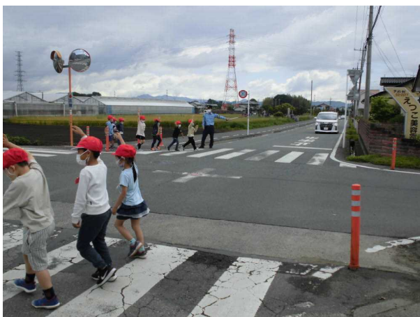
（1年生が，手を上げて渡っています。）

交通指導員さんは，毎日，登校時にそれぞれの場所で，交通指導をしてくれています。交通指導員さんとの話の中で，「あずま北小の子どもたちはよくあいさつをしてくれる。」と言っていました。また，横断歩道を渡る時，停まってくれた車に対して，会釈をしてお礼をする子どももいる，とのことでした。運転手さんに対するお礼の姿勢も事故防止につながると感じました。