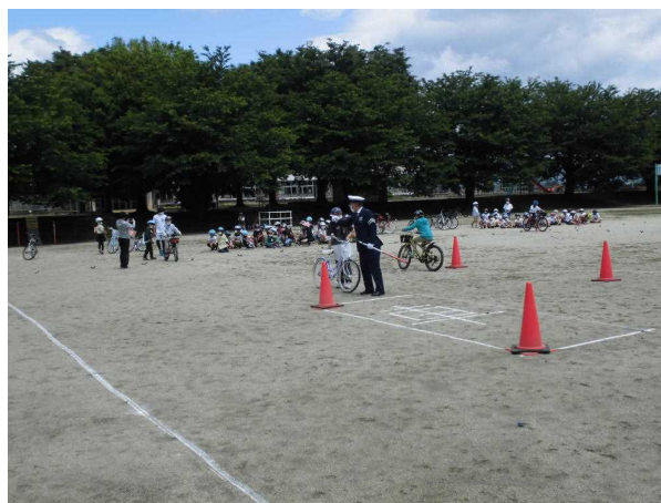
（自転車での一時停止練習です。）