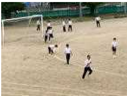
制服で!?リレーの練習