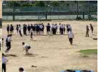
応援の先生から檄が飛ぶ