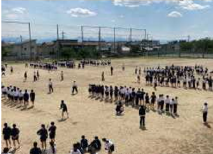
校庭全面を使っでの長縄練習